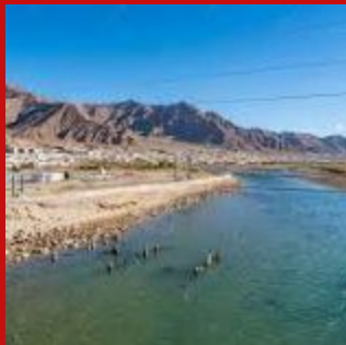
Шакимардан, Кыргызстан - Узбекиста