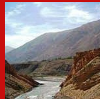
Заравшан, Таджикистан - Узбекистан