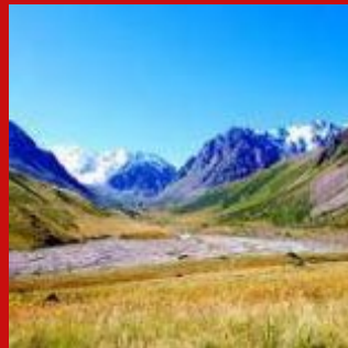
Чон-Кемин (киргизская сторона) / вся река Чу (казахская сторона), Кыргызстан - Казахстан