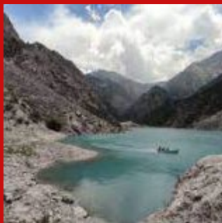
Исфайрам-Сай, Кыргызстан- Узбекистан