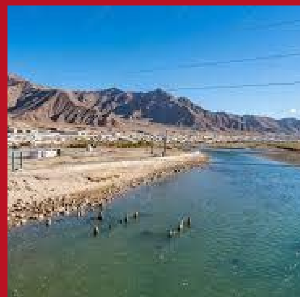
Шакимардан, Кыргызстан - Узбекистан