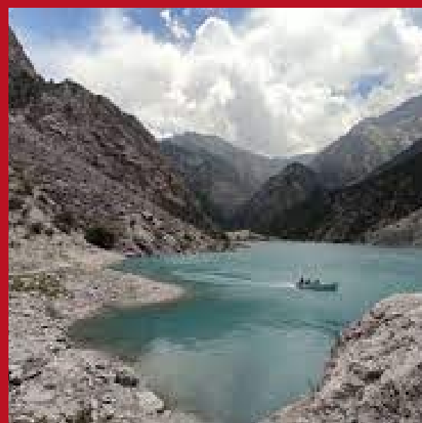
Исфайрам-Сай, Кыргызстан — Узбекистан