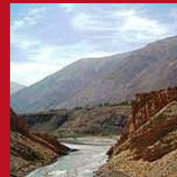
Заравшан, Таджикистан - Узбекистан