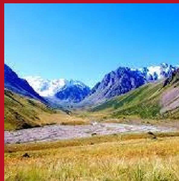
Чон-Кемин (киргизская сторона) / вся река Чу (казахская сторона), Кыргызстан - Казахстан